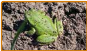
BIODIVERSITÀ E AMBIENTE